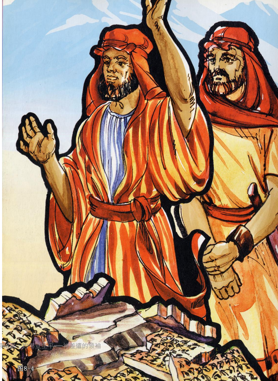
《喜乐树全人成长》第7辑第3卷：《希业生平——被差遣的领袖》